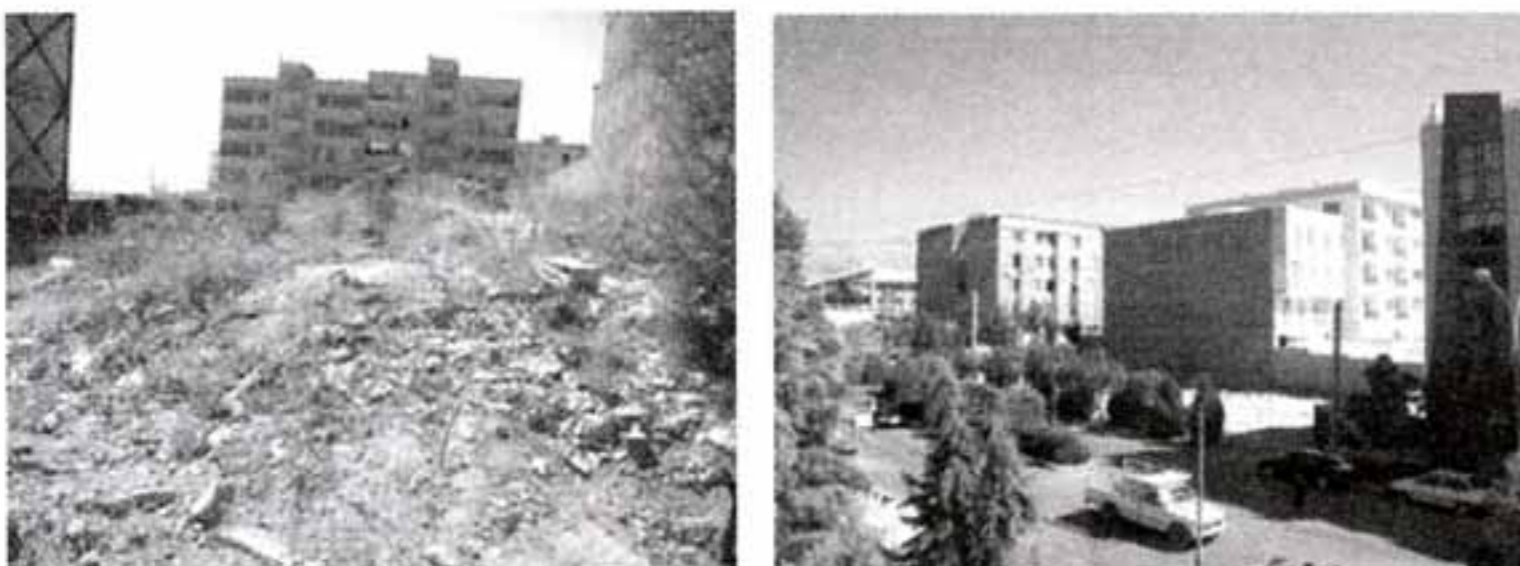
تصاویر ۱۱ الی ۱۴ - شهر جدید هشتگرد.