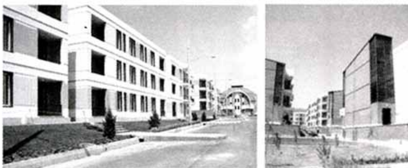
تصاویر ۳ الی ۶- شهر جدید پرند. (ماخذ: نگارندگان)

محیط‌زیست و استفاده بی‌رویه از انرژی و منابع طبیعی گشته است، توصیف و سپس تحلیل شده است.