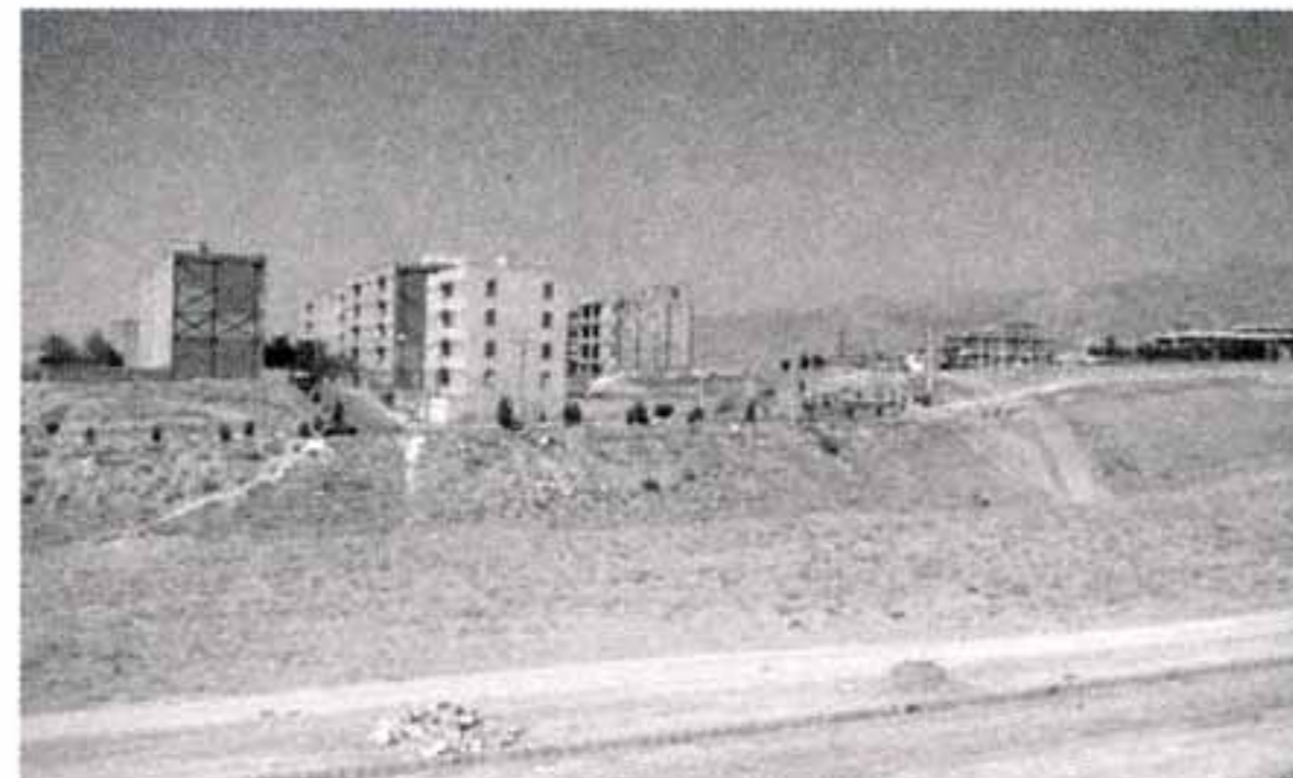
تصاویر ۱ و ۲ - رشد بی‌رویه بافت‌های مسکونی پیرامون تهران سبب از بین رفتن زمین‌های بکر و توسعه افقی دسترسی‌ها گشته است.