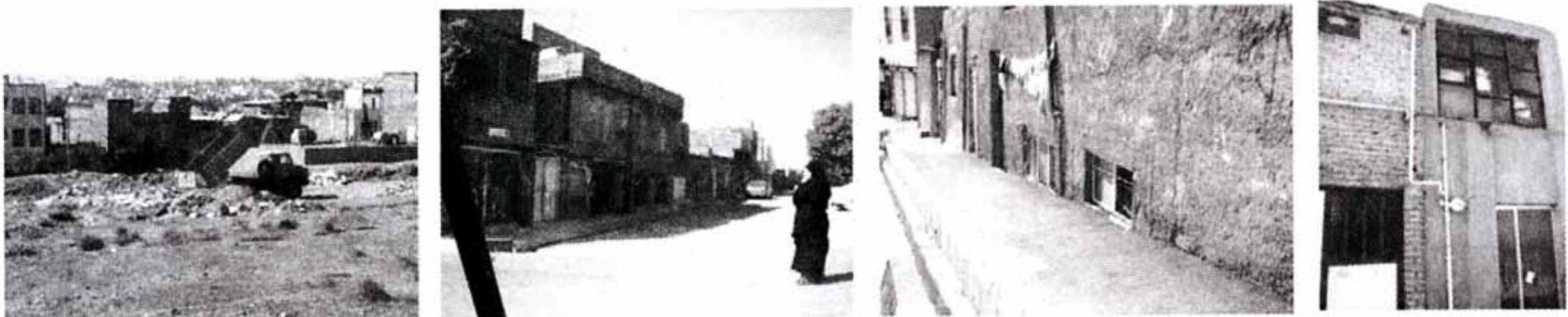
تصاویر ۱۵ الی ۱۸ - شهرک وردآورد.