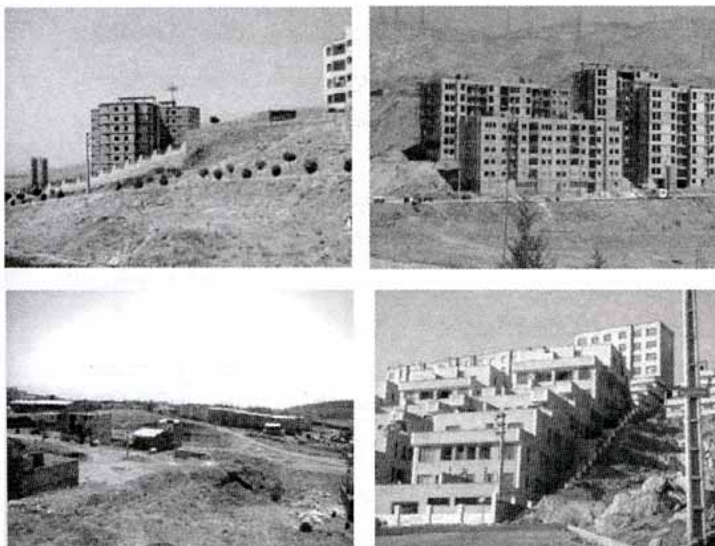
تصاویر ۷ الی ۱۰- شهر جدید پردیس

است. با توجه به طراحی این شهر بر اساس برنامه از پیش تعیین شده و انجام مطالعات اولیه شهرسازی و امکان‌یابی در ایجاد شهر جدید هشتگرد، این شهر نسبت به شهر قدیم از نظر زیرساخت‌های شهری وضعیت مطلوب‌تری دارد. وضعیت شبکه‌های خیابان‌کشی، تأسیسات شهری، و حتی ساختمان‌سازی در شهر جدید بهتر از شهر قدیم است