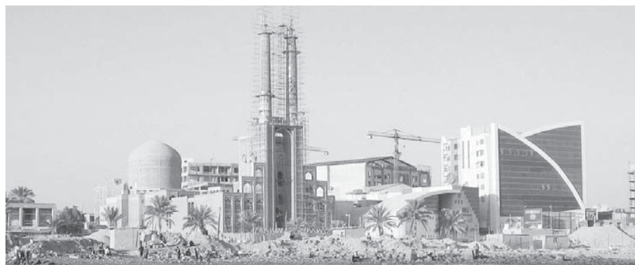
تصویر ۳. سبک‌های متفاوت و همجواری ناسازگار معماری در ساحل بندرعباس؛ ماخذ: نگارندگان، آذر ۱۳۸۹.