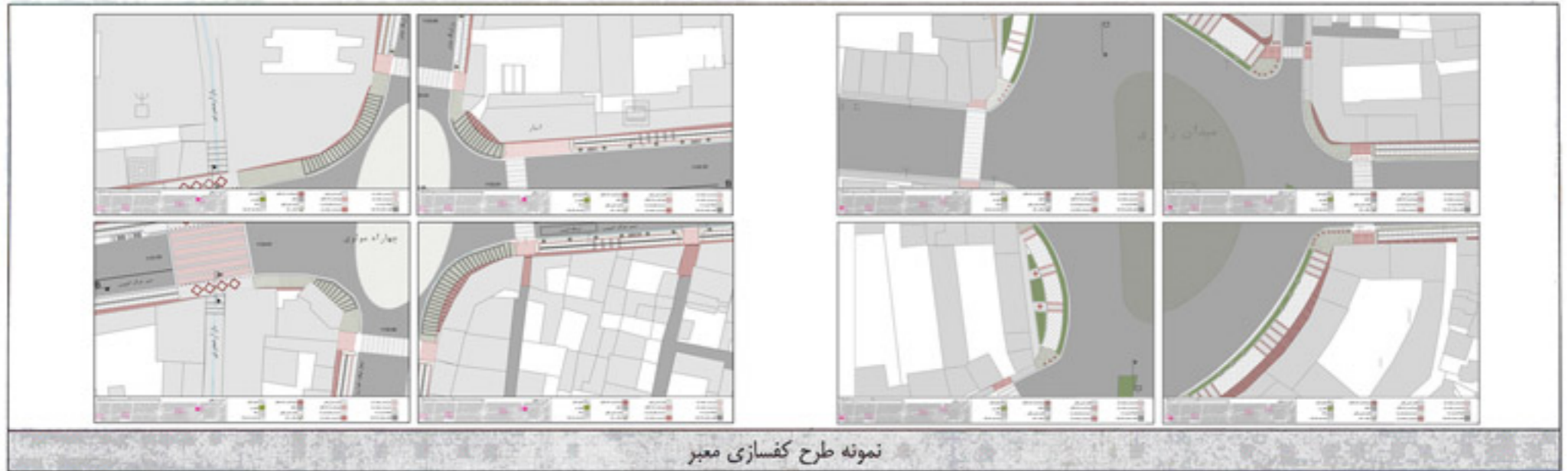
نمونه طرح کفسازی معبر