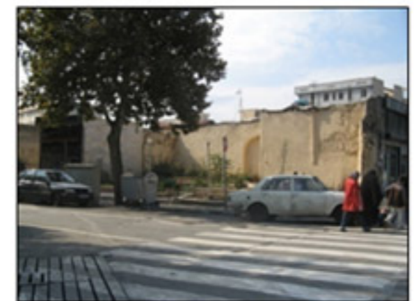
نمونه‌ای از معلود فضای مکث موجود در جداره خیابان