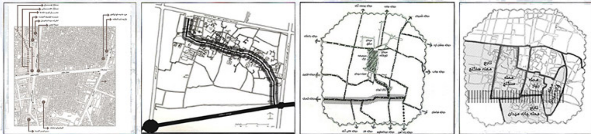
نشانه‌ها و مکان‌های معنی دار خیابان مولوی

این خیابان در سال ۱۲۷۰ ه.ش. که دیوارهای کهن شهر تهران به علت رشد و گسترش جمعیت فرو ریخته می‌شود و شهر از چهار سو گسترش می‌یابد و مساحت آن چندین برابر می‌گردد، در ساختار شهر تهران پدیدار می‌شود و به صورت یکی از اصلی‌ترین معابر شهر، دو دروازه گمرگ در غرب و خراسان در شرق را به هم وصل می‌کند. خیابان مولوی در مرز فضایی محلات سنگلج، بازار و چاله میدان قرار گرفته است. این محلات به عنوان اصلی‌ترین محلات تهران قدیم امروزه نیز ساختار خود را کمابیش حفظ کرده‌اند و جزء بافت‌های کهن و البته فرسوده تهران به شمار می‌روند. نزدیکی و ارتباط با بازار به عنوان ستون فقرات و مرکز اجتماعی و اقتصادی شهر از جمله مهم‌ترین عوامل تاثیرگذار در حیات خیابان مولوی و محلات مجاور به شمار می‌رود، که تا امروز نیز نقش ویژه‌ای در رونق و کارایی خیابان داشته است.