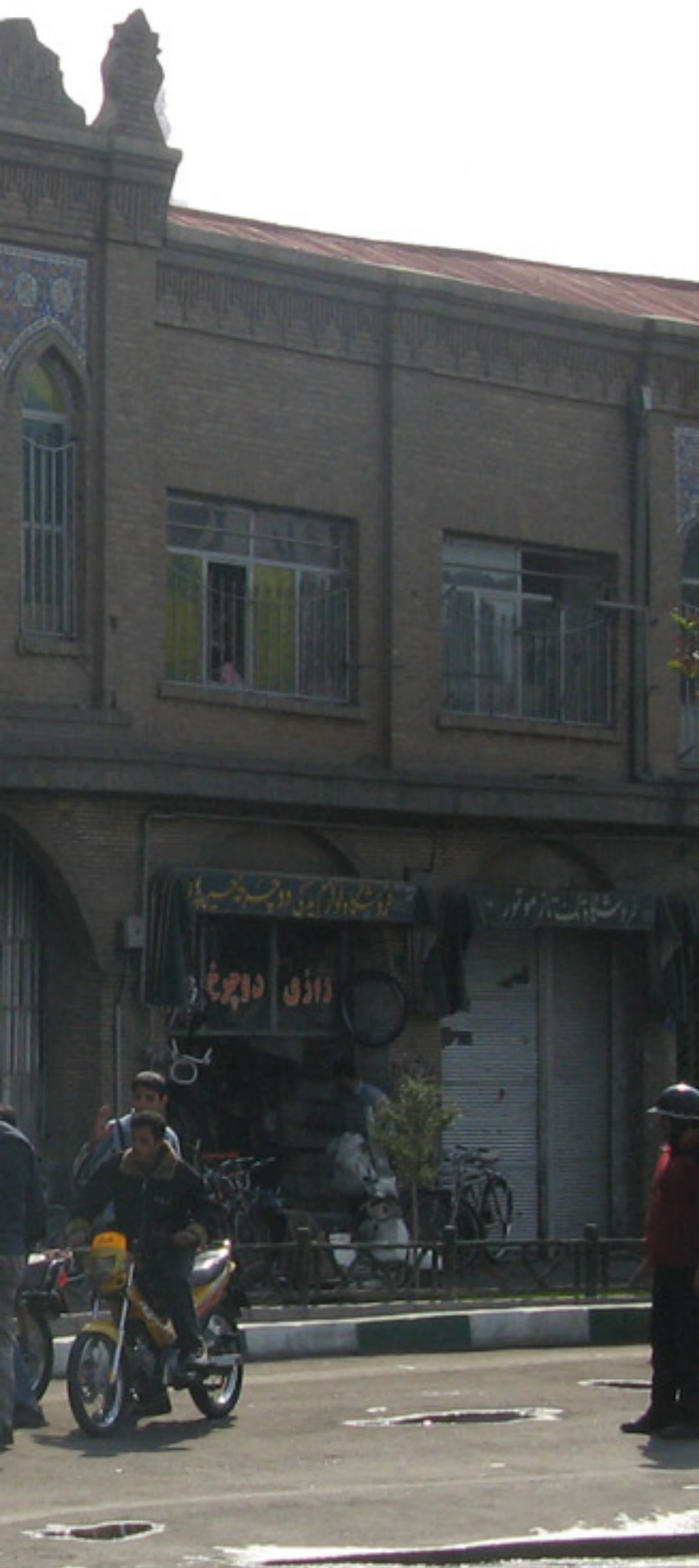
موقعیت خیابان مولوی

وجود مشکلات متعدد اجتماعی، اقتصادی منجر به فرسودگی کالبد و کاهش کیفیت زندگی در این منطقه گردیده، تا جایی که بسیاری از واحدهای مسکونی و تجاری، متروکه و مخروبه و در مواردی نیز تبدیل به کارگاه‌های صنعتی و انبار بازاریان گشته‌اند، فضاها و مکان‌های شاخص و ارزشمند موجود نیز، عموماً چهره از کف داده و نقش چندانی در حیات و کارایی خیابان ندارند، این امر سبب افت کیفیت سکونت و جایگزین شدن ساکنین اصلی با مهاجرینی گردیده که تعلق خاطری به محله ندارند و ادامه روند فعلی موجب از میان رفتن فضاهای آشنا و شکل‌گیری فضاهایی می‌گردد که فاقد احساس امنیت می‌باشند. اما علاوه بر فرسودگی کالبد به علت نبود ضابطه و قاعده معینی، ساختمان‌های جدیدالحدث نیز عمدتاً شتابزده و بدون ارتباط با ارزش‌های فضایی خیابان ساخته می‌شوند از این‌رو در حال حاضر بدنه خیابان صورتی ناهماهنگ دارد. مضاف بر اینکه آلودگی، شلوغی و ازدحام ترافیک ناشی حضور ماشین، مجالی برای حضور افراد پیاده و تجربه و درک ارزش‌های فضا باقی نمی‌گذارد. مجموع عوامل مذکور سبب گشته بافت از درون تهی شده و خیابان و کالبد همجواری به مجموعه‌ای آشفته و نابسامان مبدل شوند و بدین ترتیب شرایط دشواری برای اصلاح فضایی خیابان پدید آمده است.