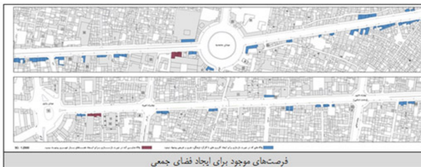
فرصت‌های موجود برای ایجاد فضای جمعی