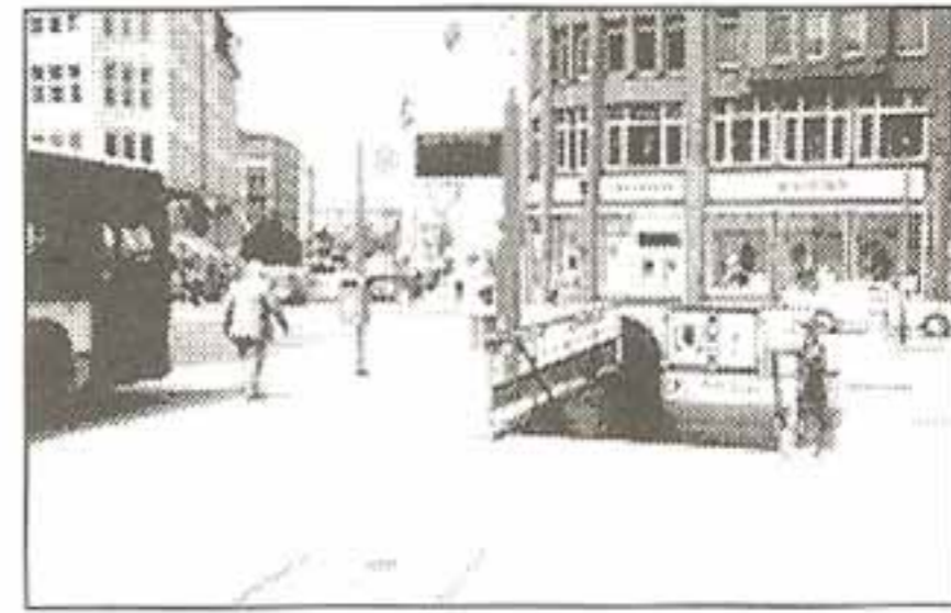
ورودی مترو (هامبورگ)